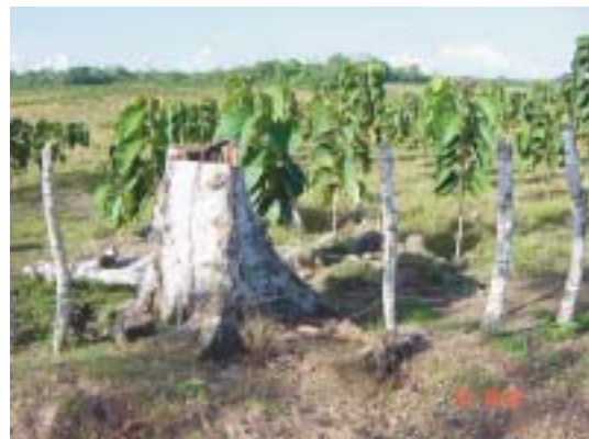
Fig. 1. Crecimiento de la teca en Ultisoles en la zona Norte de Costa Rica.

afecta en forma negativa el crecimiento de los árboles de teca (Figura 1). Aunque pueden presentarse algunos efectos de la acidez del suelo sobre el sistema radical de los árboles, estos no se estudiaron en el presente trabajo. En árboles afectados por este problema, después de cierto número de años se puede observar que las raíces sufren un necrosamiento, que se inicia en la parte apical de la raíz y con el tiempo se acerca a la base del árbol.