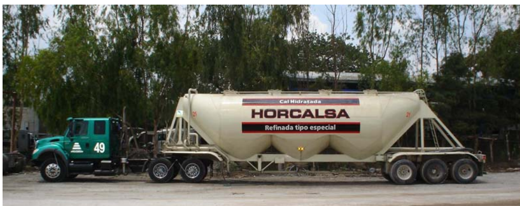
Figura 5: Ejemplo de pipa típicamente usada para entrega de cal seca.

La cal viva o la cal hidratada seca, puede ser entregada en bolsas de papel o bien en pipas (Figura 5). Cuando se transporta en pipa es común que, cada carga de cal seca entregada en un sitio de trabajo lleve una boleta certificando la cantidad de cal a bordo. Además, algunas entidades requieren la certificación de las características químicas de la cal entregada.