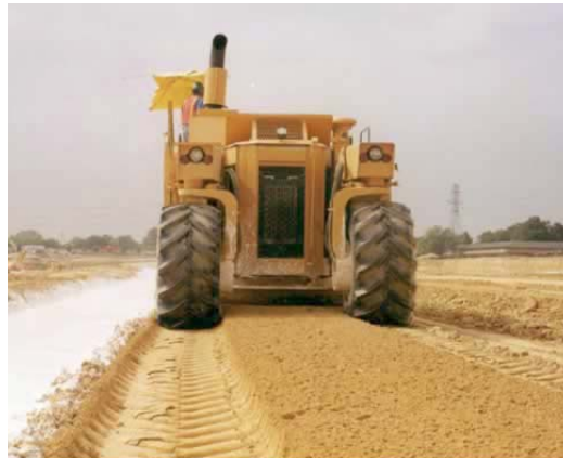
Figura14: Estabilizadora de suelos utilizada para la mezcla inicial.

Las estabilizadoras de suelos (Ej. CAT SS-250B) pueden ser utilizadas para asegurar la mezcla cuidadosa de la cal, el suelo, y el agua (Figura 14). Con muchas estabilizadoras de suelos, el agua puede añadirse al tambor de mezcla durante el proceso (Figura15). Este es el método óptimo de adición de agua a la cal (cal viva o hidratada) y al suelo secos, durante la mezcla preliminar y la etapa de riego.