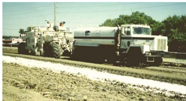
Figura15: Estabilizadora de suelos con camión de agua.

Independientemente del método usado para la adición de agua, es esencial que la cantidad de agua agregada sea la adecuada para asegurar la completa hidratación y llevar el contenido de humedad del suelo 3% arriba del óptimo, antes de la compactación.