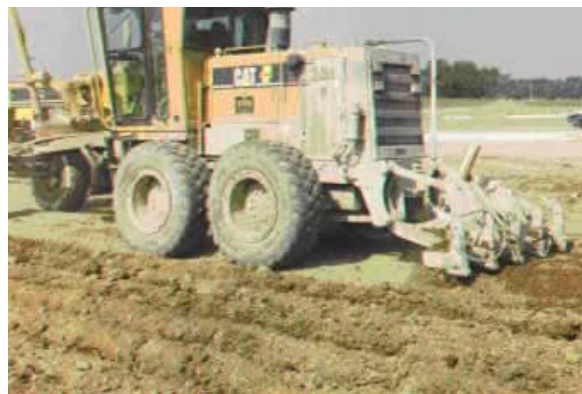
Figura 8: Escarificación antes de la aplicación de la cal.

En el pasado era una práctica común escarificar antes de la aplicación. Hoy en día, debido a la disponibilidad de mezcladores superiores, la cal a menudo es aplicada sin la escarificación. Los camiones de cal también pueden transitar la carretera con más facilidad si está compactada, más bien que escarificada, en particular sobre suelos mojados. La principal desventaja de este procedimiento, sin embargo, se da por factores meteorológicos; cuando la cal es colocada sobre una superficie lisa, hay mayor posibilidad para la pérdida debido al viento y al proceso, particularmente si la mezcla no se realiza de inmediato. Para eliminar la pérdida hacia los lados, se puede construir un pequeño camellón, utilizando material del camino (Figura 9).