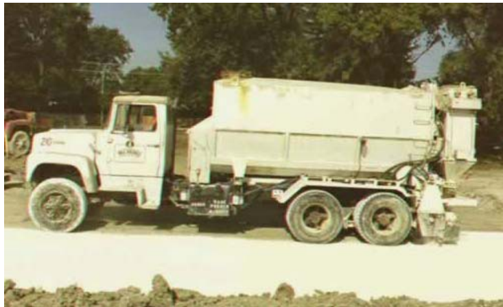
Figura10: Uso de cal seca con aplicación mecánica 4 .

Para el empleo de una barra de extensión neumática, la cal viva se muele ( \frac{1}{4} " por 0) para fluir libremente. aplicador mecánico sobre la parte posterior de un camión o trailer, o una caja separada puede manejar la cal viva menos fina - comúnmente hasta \frac{1}{2} " de diámetro. La subbase puede ser escarificada para este tipo de uso. Este uso trabaja bien en condiciones de suelo muy mojadas.