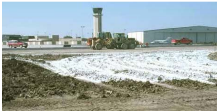
Figura 21: Proyecto de estabilización en un aeropuerto.

La cal tiene una historia extensa como una opción de tratamiento de suelos para la construcción de aeropuertos. Los ejemplos incluyen el Aeropuerto Internacional de Denver, el Aeropuerto Dallas Ft. Worth y Newark. Muchos aeropuertos en los Estados Unidos se amplían alargando las pistas de aterrizaje y despegue, calles de taxeo y estacionamientos (Figura 21).